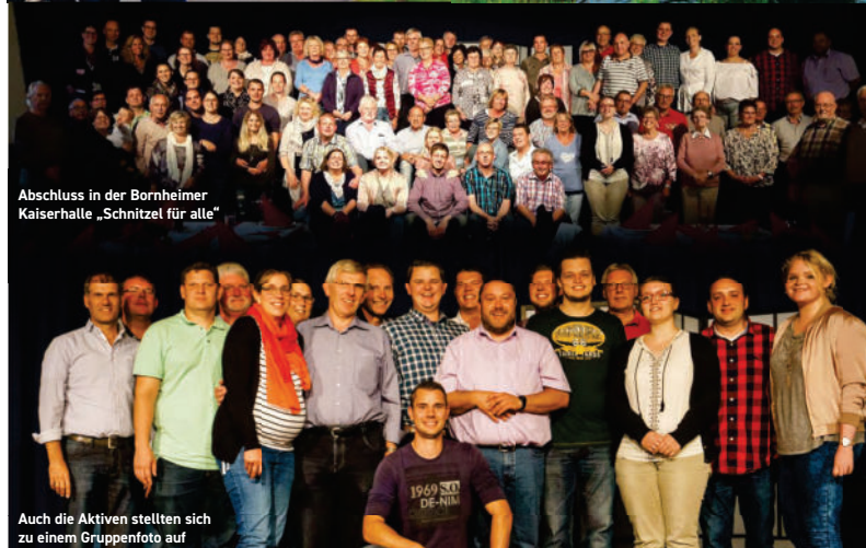
Abschluss in der Bornheimer Kaiserhalle „Schnitzel für alle“