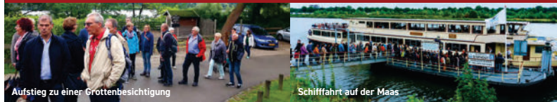
Aufstieg zu einer Grottenbesichtigung